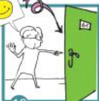
16 Jsi negativní: pokračuješ do výuky s ostatními