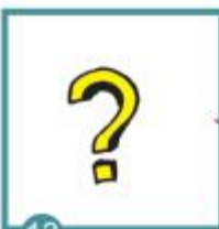
13 Ukazuje to něco jiného? Výsledek se zaznamená test je neplatný, musíš se otestovat znovu