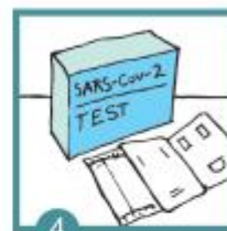
4 Rozbalíš si test