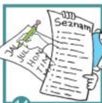
14 Výsledek se zaznamená