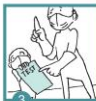
3 Dostaneš instrukci