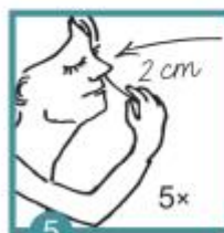
5 Tyčinkou 5x otočíš v každé nosní dírce