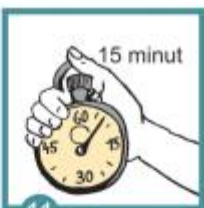
11 Stopujeme 15 minut