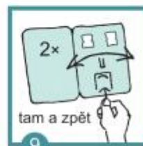
9 Otočíš 2x tyčinkou tam a zpět