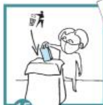
15 Test vyhodíš a vydezinfikuješ si ruce