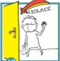
17 Jsi pozitivní: počkáš na rodiče a jdete domů