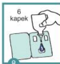
8 Test se zakape roztokem