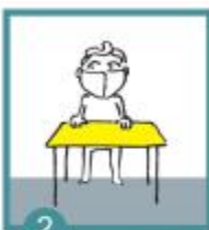
2 Posadíš se ke stolu