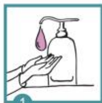
1 Vydezinfikuješ si ruce