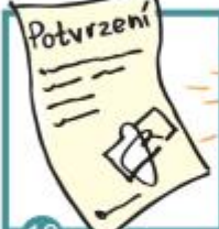
18 Škola ti vystaví potvrzení o tom, že ti test vyšel pozitivně