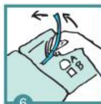
6 Odstraníš fólii z testu